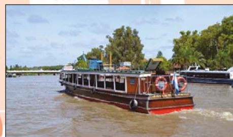
Delta del Tigre