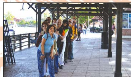
Compagni di viaggio