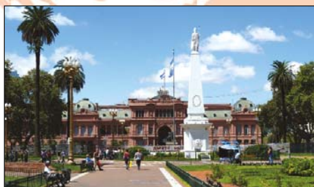
Buenos Aires, Plaza de Mayo

Londra Heathrow/Milano Linate – 07.35-10.35